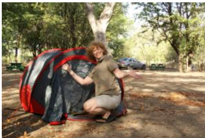
Gekampeerd in camp Letaba