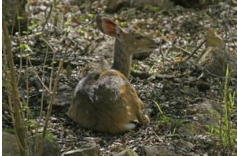
Bosbok bij Mhofu