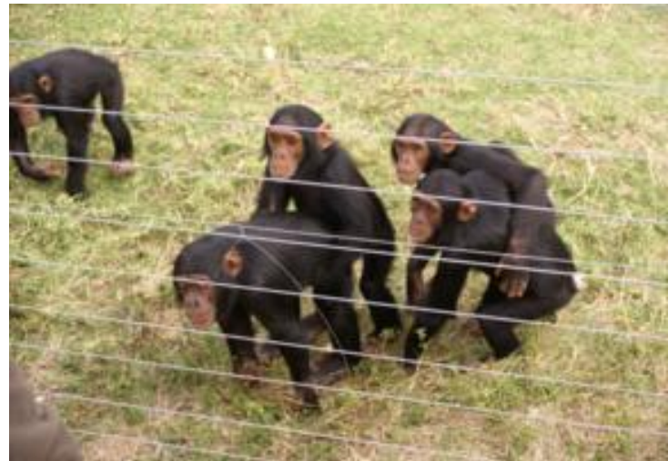
Jane Goodall Chimps Eden