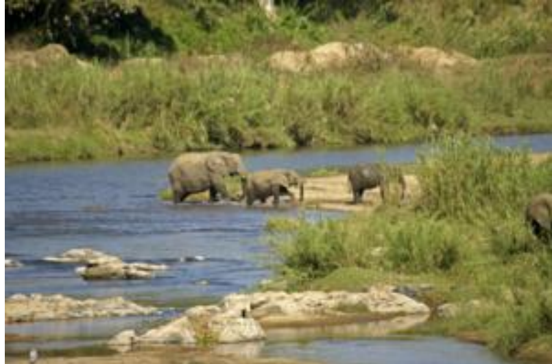
krokodilrivier bij Malelane