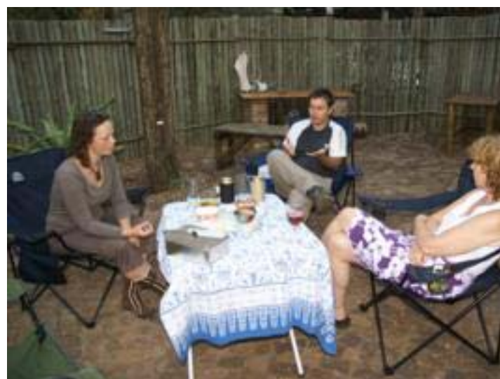
Vrienden braaien met ons