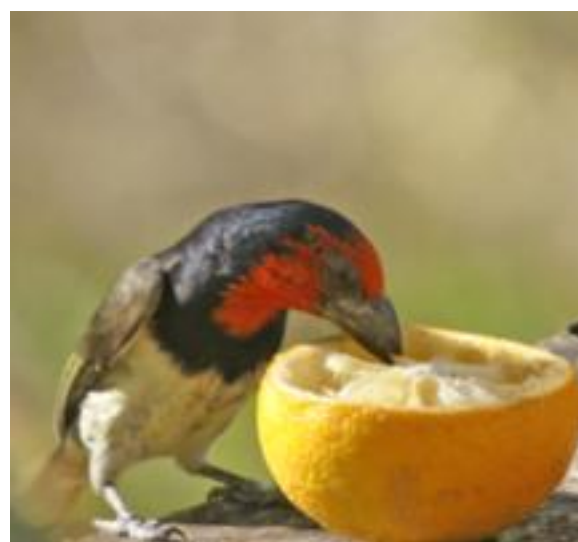
Rooikop houtkapper bij Mhofu