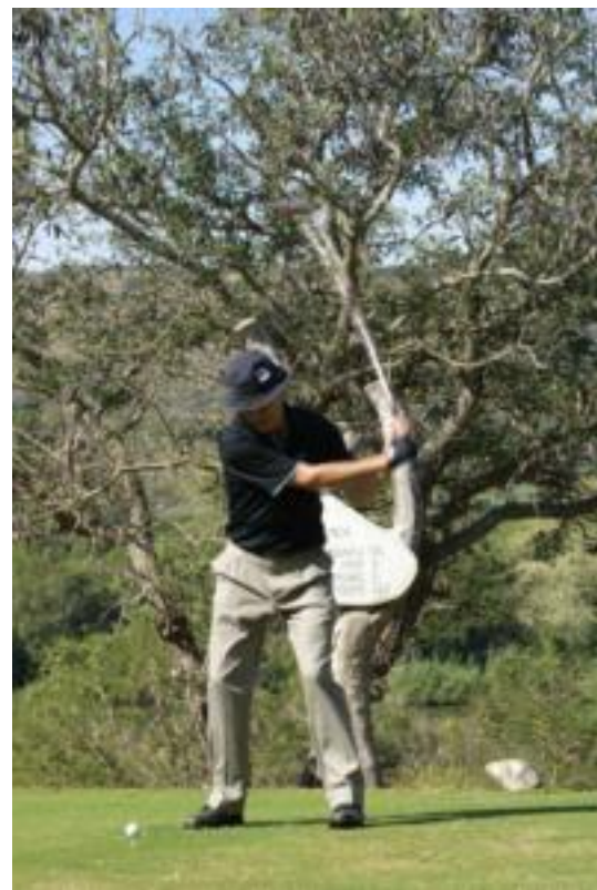
Golfen in Komatipoort