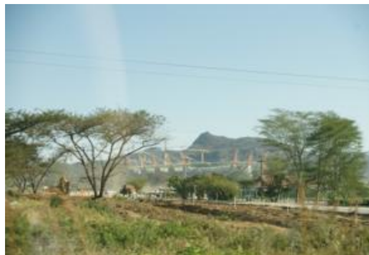
Voetbalstadion in Nelspruit