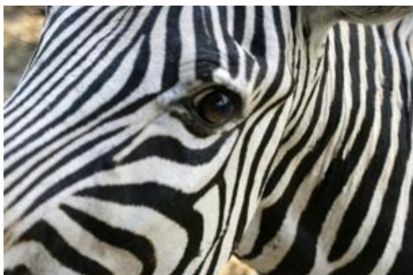
Zebra bij Mhofu