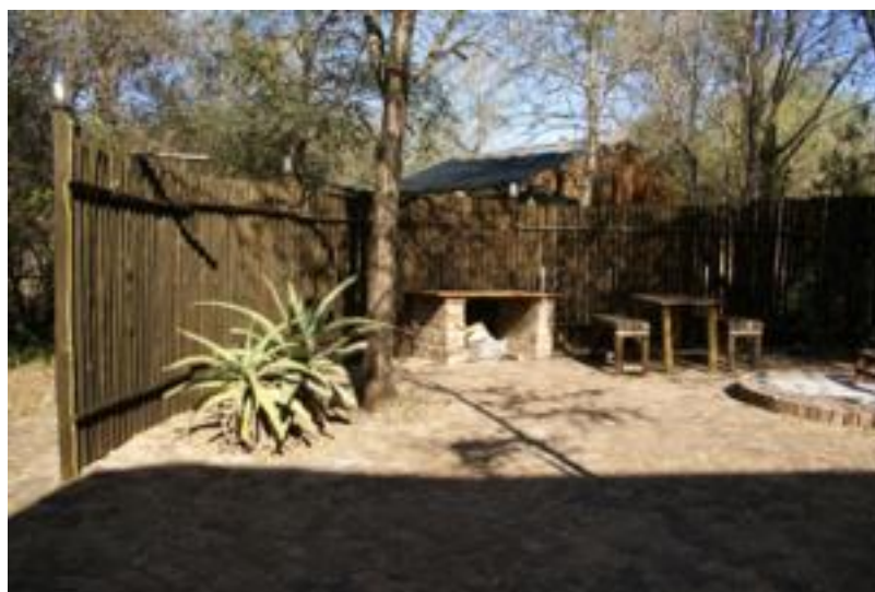
Boma in de olie gezet!