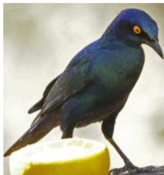
Glanspreeuw bij Mhofu