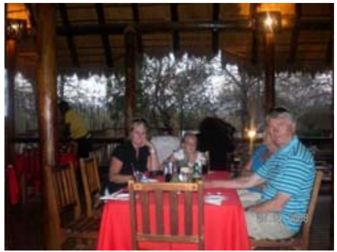
Watergat Restaurant Marloth Park