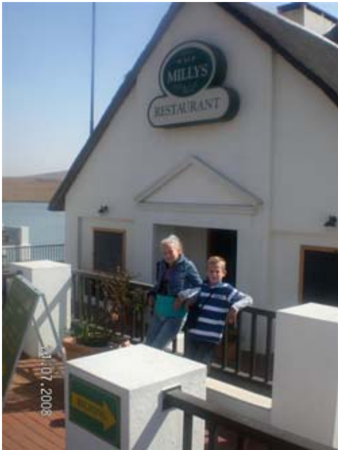
Milly's aan de N4