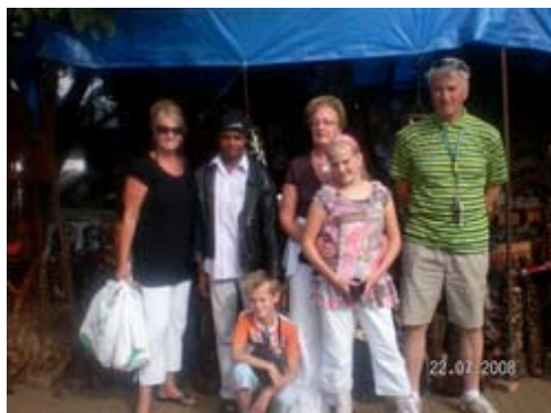
Bij Mildo Kunst kopen