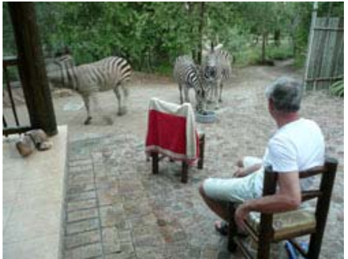
zebra bij Mhofu