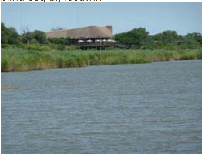
Sabierivier, kamp Lower Sabie