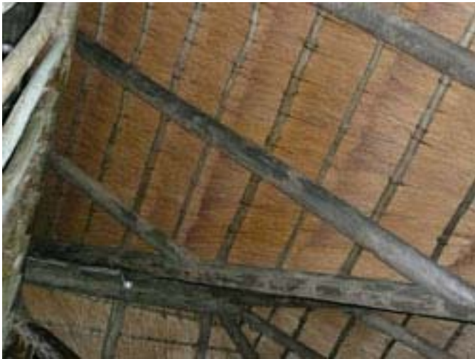
het dak binnen