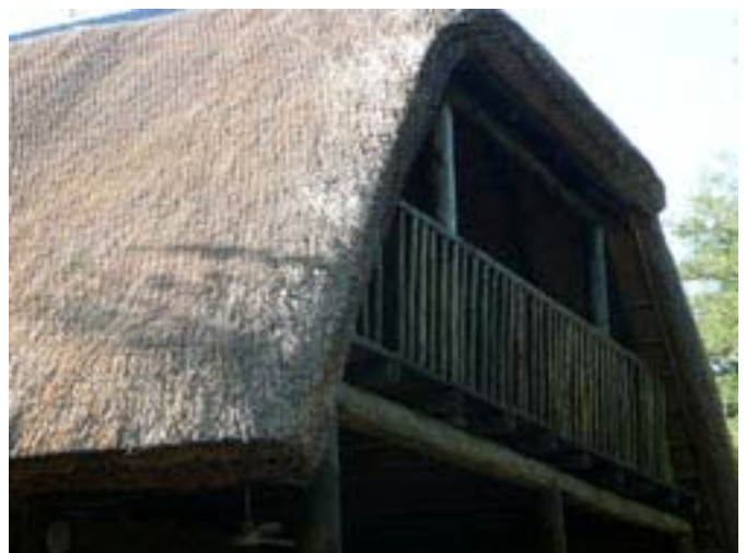
balkon van Mhofu