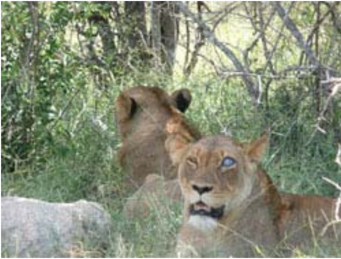
blind oog bij leeuwin